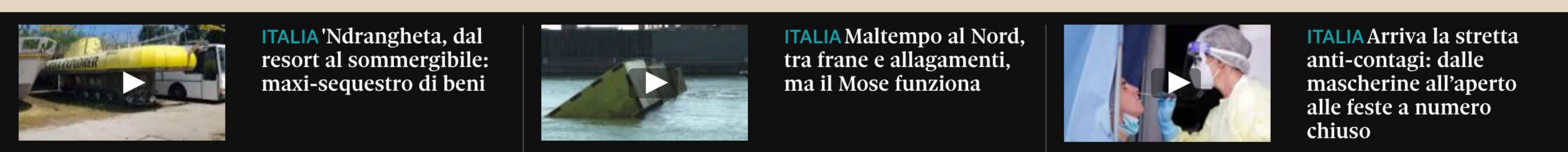
ITALIA Ndrangheta, dal resort al sommergibile: maxi-sequestro di beni